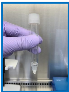
泡が少ない 十分量採取されている