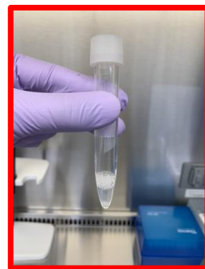
泡が多い 十分量採取されていない